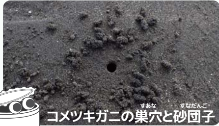
コメツキガニの巣穴と砂団子

当館のすぐ目の前の海は、潮が引くと広い干潟となります。干潟にはいろいろな生きものが暮らしていますが、今回は、たくさんいるコメツキガニとコビナガホンヤドカリの見つけ方を紹介します。