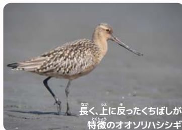
長く、上に反ったくちばしが特徴のオオソリハシシギ

春は野鳥の渡りの季節! 三番瀬でも羽の色が鮮やかになった鳥たちがやってきます。鳥の種類も1年の中でもっとも多いのが春です。今回はそんな三番瀬の春を代表するオオソリハシシギのユニークなくちばしをご覧ください。(大谷)